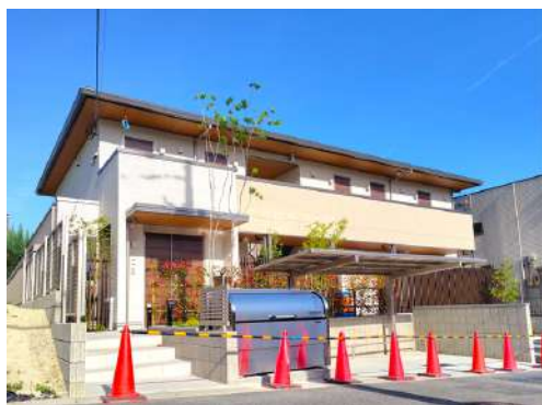
新しく建築中の新きょうわ

駐車場で花火大会をしたり、リビングで流しそうめんをしたり…。入所者に縄跳びやバドミントンに付き合ってもらいたいと誘われて中庭や駐車場で一緒に遊んだこともありました。