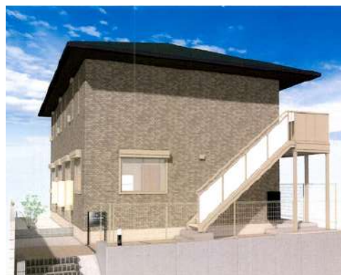
「大高ベース」アパート完成予想図