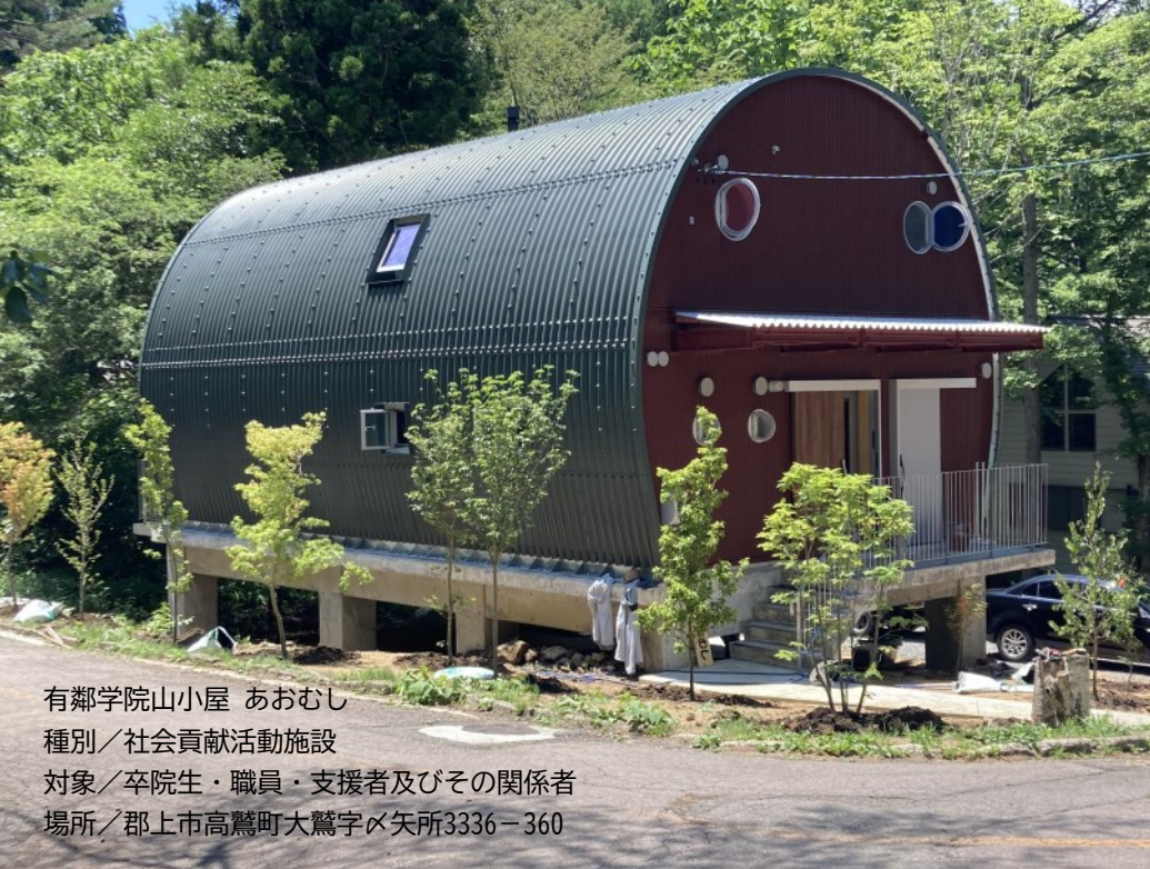
有鄰学院山小屋 あおむし 種別／社会貢献活動施設 対象／卒院生・職員・支援者及びその関係者 場所／郡上市高鷲町大鷲字×矢所3336-360